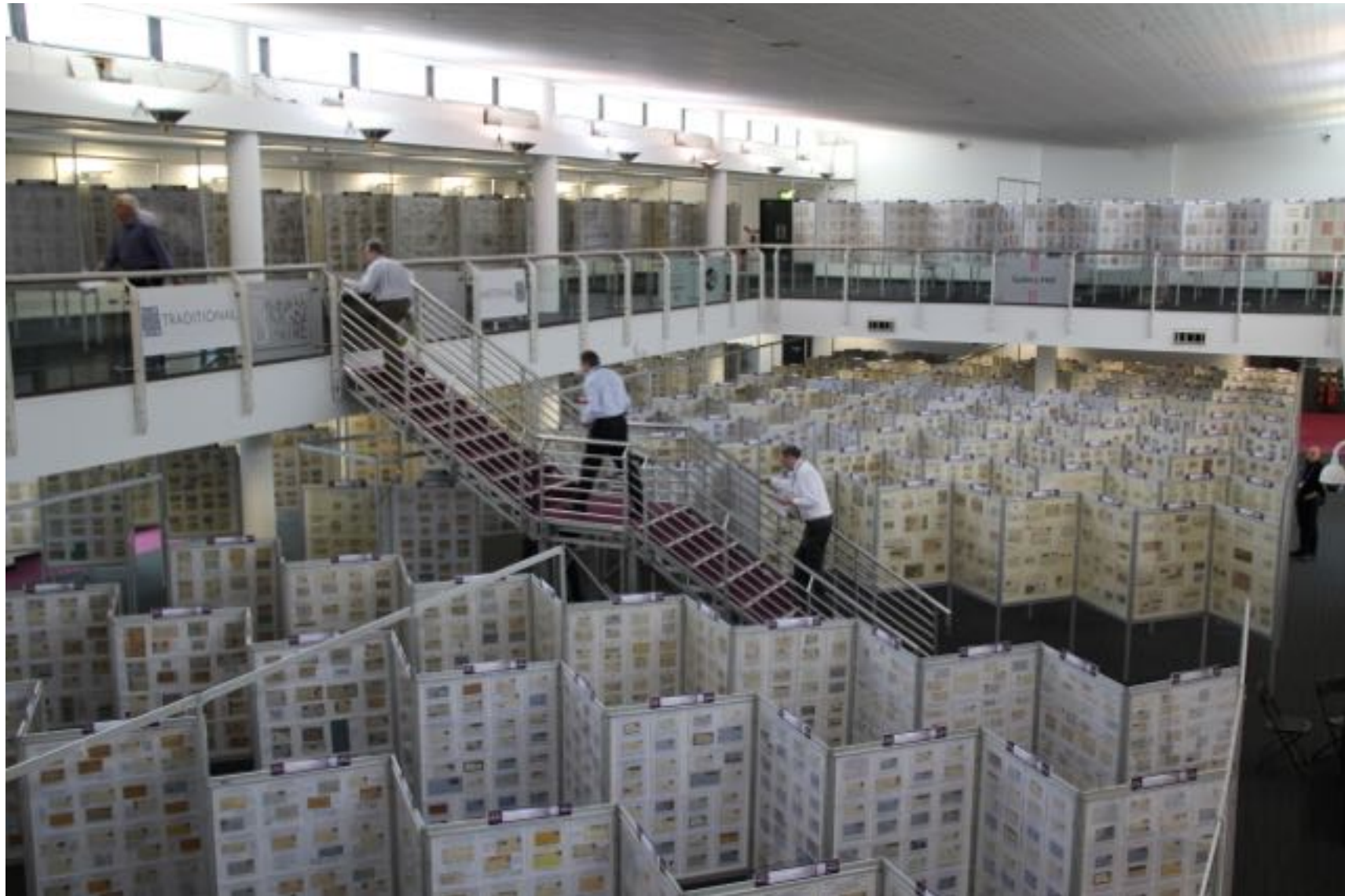
Halleja, joihin kokoelmat olivat sijoitetut, vaivasi huono valaistus. Jo yleisvalaistus oli niukka ja halleissa oli monia osuuksia, joissa kokoelmiin paneutuminen olisi edellyttänyt otsalamppua.