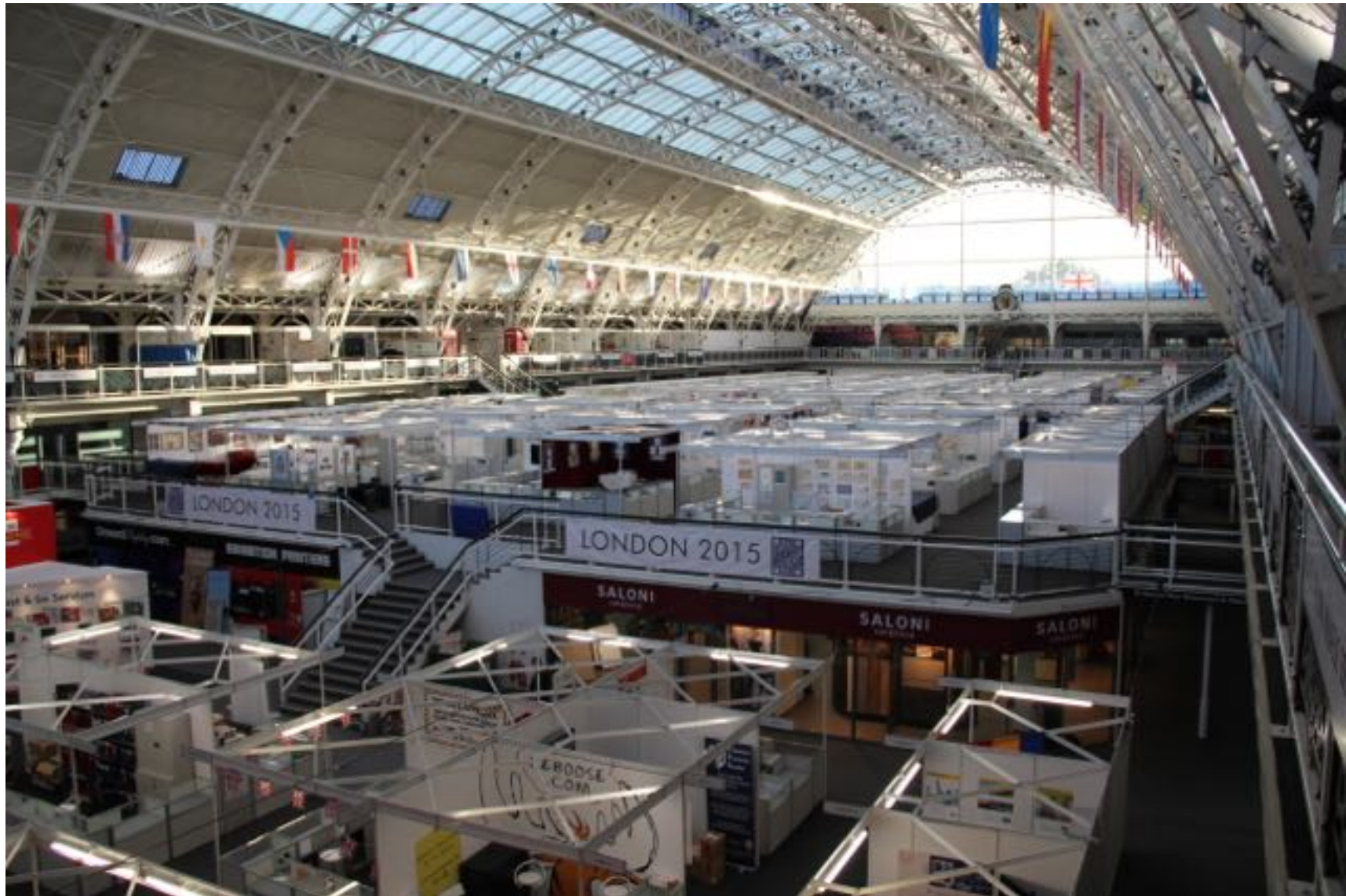
Kauppiaita oli 142. He olivat saaneet sen hallin, jossa oli paras valaistus.