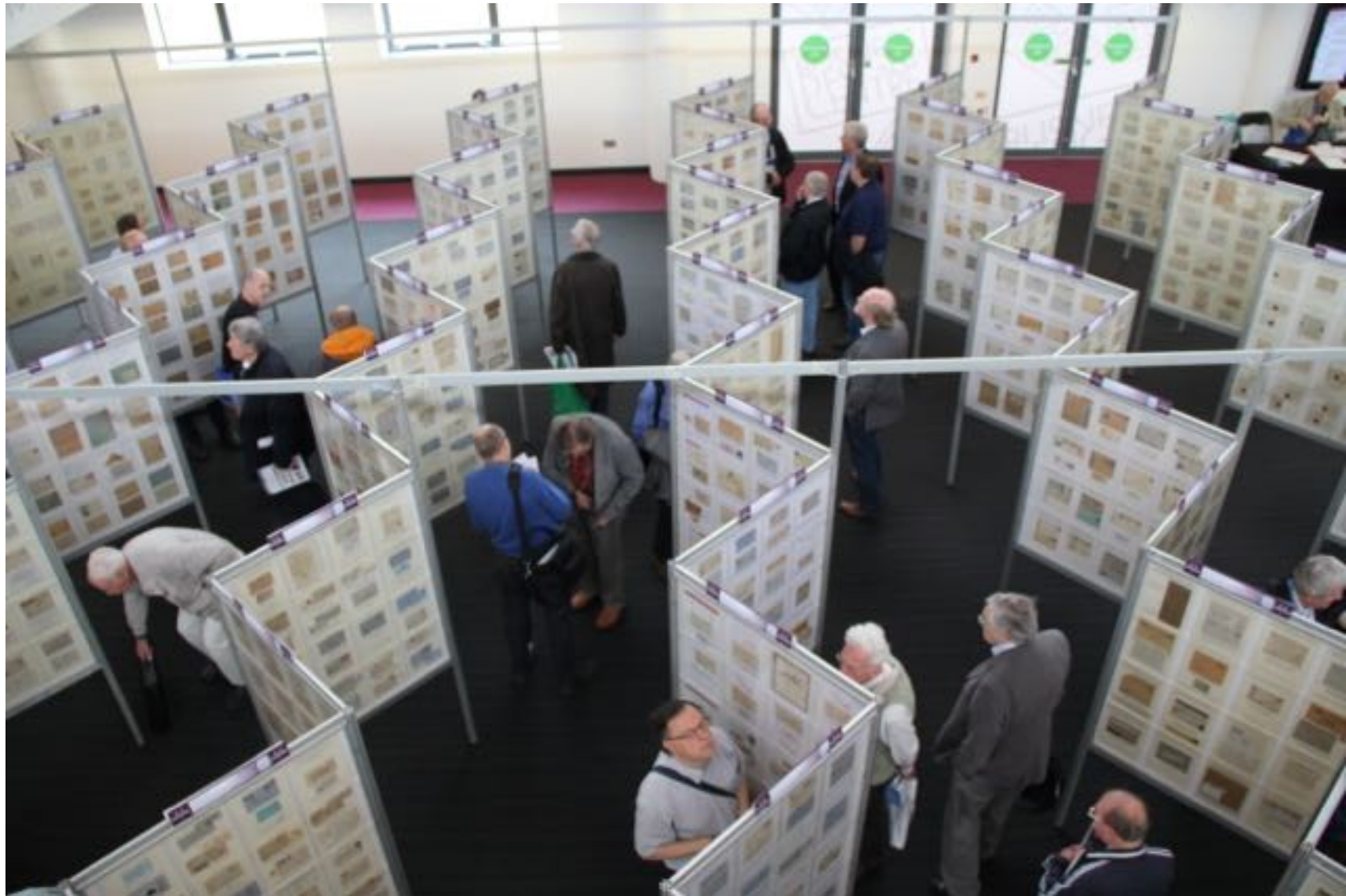
Vaikka kokoelmat olivat päähallina toimivasta kauppiashallista muutaman mutkan takana, niin tasaisesti kokoelmiin tutustui ihmisiä